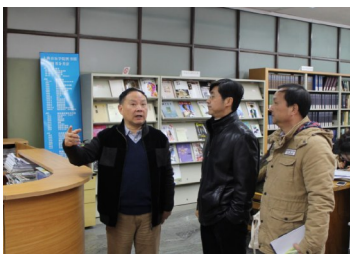
院领导对我院校区各地进行安全检查